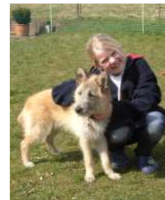
Circe, ora chiamata Paula, in Germania!

Ma nonostante tutto il vento sta cambiando! I proprietari di cani e gatti castrati sono ormai migliaia. E non solo dalla nostra clinica. Tutti i veterinari sono all'opera! Ma gli animali castrati non sono ancora abbastanza. Il tasso di proliferazione è ancora troppo alto. Cio nonostante dobbiamo continuare, dobbiamo "chiudere il rubinetto" fino che le "poche gocce" residue possano facilmente trovare sistemazione. I canili, anche se ben tenuti, non sono il posto dove gli animali dovrebbero vivere. Sono necessari come luogo di sosta temporaneo fino a che non si trovi una nuova famiglia che soddisfi i loro fabbisogni psicofisiologici. Forse mi sbaglio, ma qualche volta ho l'impressione che i "protettori" degli animali siano i loro più grandi (Segue su l'ultima pagina....)i